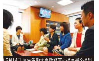
6月14日 厚生労働大臣政務官に提言書を提出

阿部知子参議院議員を座長、山尾志桜里衆議院議員を事務局長とする民進党待機児童問題プロジェクトチームに、副事務局長として参加しました。子ども達が走り回り泣きわめいたりする会議室で、待機児童問題真っ只中のパパママ＆パパママ議員が、命を抱く学び舎を子ども達に贈るため提言書を作成しました。単なる受け皿整備を急ぎ、保育の質を落とす規制緩和を主とする政府案との大きな違いは、当事者感と「命に対する凄まじいこだわり」です。