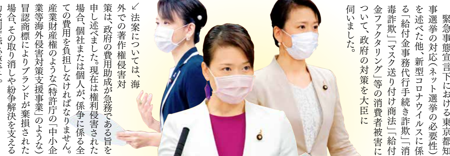
6月2日 文教科科学委員会 著作権法改正案参考人質疑▲