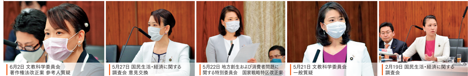
6月2日 文教科学委員会 著作権改正案 参考人質疑 5月27日 国民生活・経済に関する 調査会 意見交換 5月22日 地方創生および消費者問題に 関する特別委員会 国家戦略特区改正案 5月21日 文教科学委員会 一般質疑 2月19日 国民生活・経済に関する 調査会