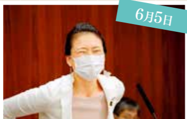
公益通報者保護法改正案の付帯決議案を読み上げ

今 国会は「国家戦略特別区域法の一部を改正する法律案」「地域の自主性および自立性を高めるための改革の推進を図るための関係法律の整備に関する法律案」「公益通報者保護法の一部を改正する法律案」の3つの法案が付託されました。野党筆頭理事の仕事は、野党全体の意見集約・調整の他、与党筆頭理事との委員会審議日程や質問時間配分、細かい手続きなどの交渉(筆頭間協議)の他、党所属議員や共同会派(立憲民主党・社民党)との連絡・調整・質問者の決定、党国会対策委員会(国対)との連携など多岐にわたります。